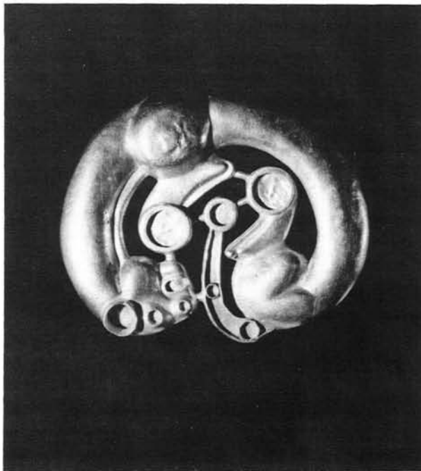
Panther im Rolliertypus Gold, 10.9 x 9.3cm, Skythisch-sibirisch, um 600 v. Chr. Die Staatliche Eremitage, St. Petersburg

Zu einer Sonderausstellung im Raetischen Museum Chur (7.5.–19.9.1993)