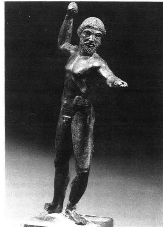
Statuette des Zeus aus Apollonia, um 460 v. Chr. Apollonia, AM 5400