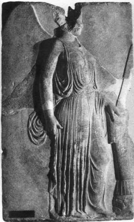
Relief mit Nike mit einem Tropaion aus Buthrotum 2. Hälfte 5. Jh. v. Chr., Parischer Marmor Tirana, NHM 1225