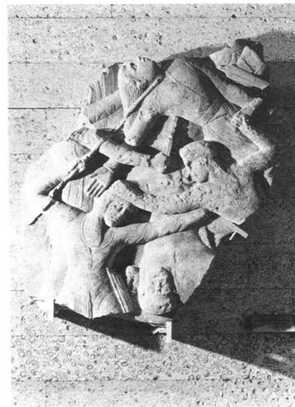
Relieffragment mit Amazonenschlacht Kalkstein, 110 x 112 cm, Bosphorus, Ende 4. Jh. v. Chr. Staatliches Puschkin Museum der Bildenden Künste Moskau